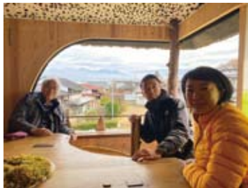
11.20 地域リサーチ「ふじもり建築」