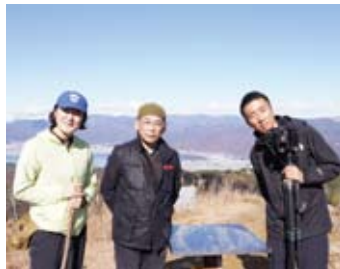
11.21 地域リサーチ「守屋山登山」